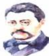
Ахмет Байтұрсынұлы - ұлт ұстазы