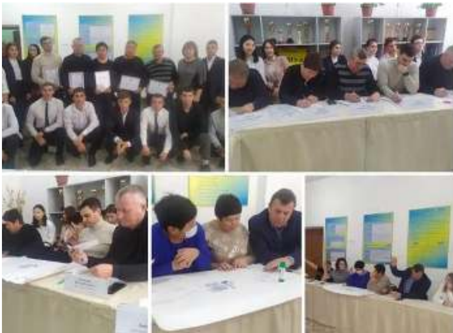
Фото: Встреча студентов с работодателями и выпускниками колледжа прошлых лет