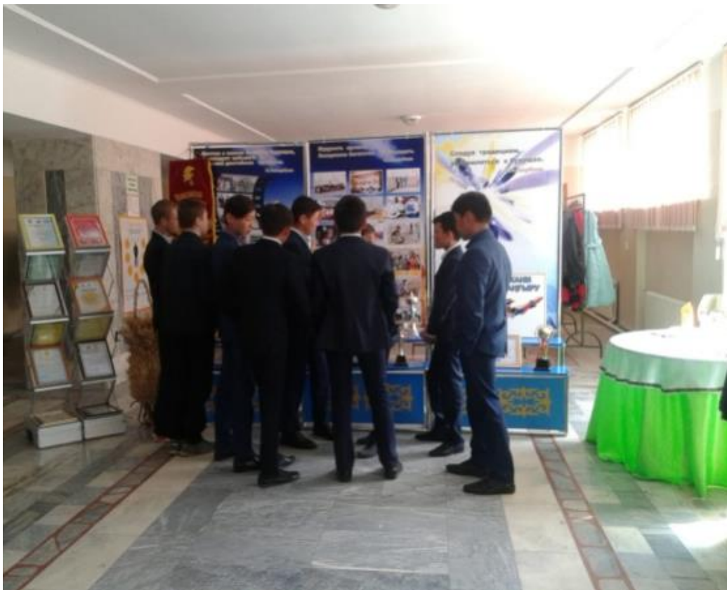
Фото: выставка достижений выпускников и студентов колледжа