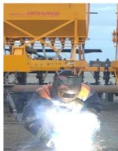
Фото: профессиональная практика студентов на предприятиях, в организациях